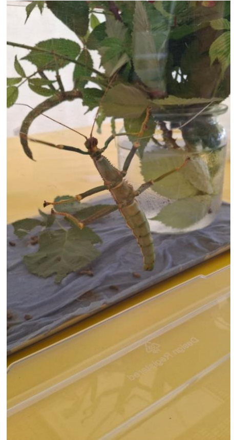
Workshops von Fraunhofer-Institut und „Grüner Schule“