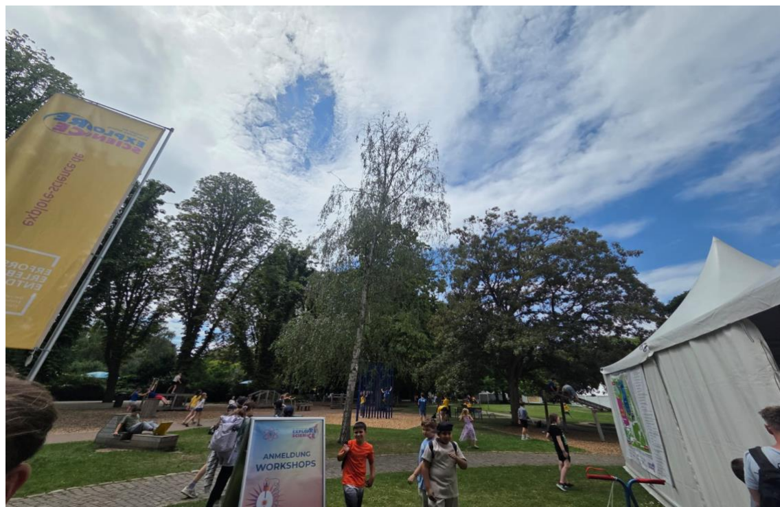
An den fünf Tagen der Explore Science Week werden mehr als 25.000 Teilnehmende erwartet.

Die Sieger standen bei Redaktionsschluss noch nicht fest. lel/jgr/ajb