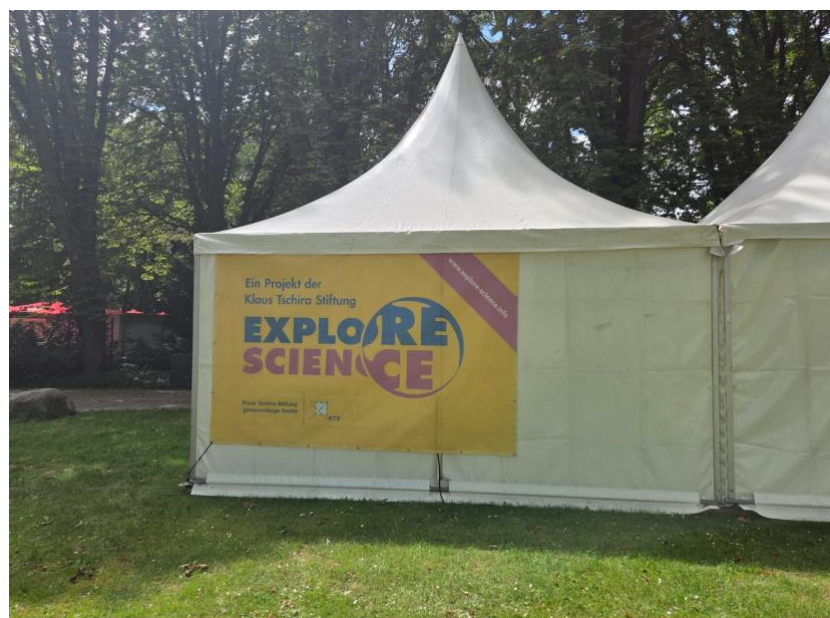
Zum 20. Mal findet Explore Science nun schon statt, Veranstalter ist die Klaus Tschira Stiftung.